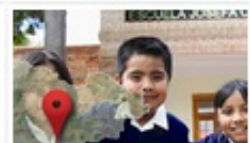
Inventario Escolar y Educativo