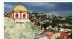
Mapa Turístico del Edo de Gto.