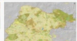
Mapa Básico del Edo Gto