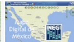
Mapa Digital de México