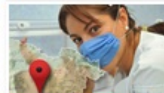
Instituciones de Salud en Gto.