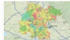
Invirtiendo en Guanajuato

Además de otros SIG, que ofrecen información temática construida con propósitos específicos, como es el caso de los programas sociales de la Sedesol; como pueden ser el de Transporte del Estado; predios Conafor; Turismo y Educación entre otros.