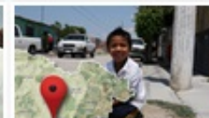
Localidades Prioritarias SEDESOL