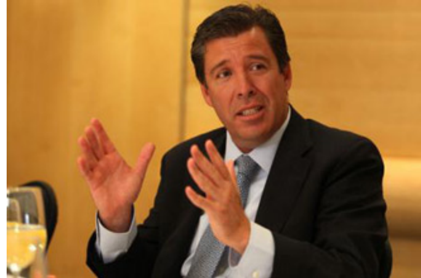
Miguel Márquez Márquez Gobernador

El Gobierno del Estado está comprometido a garantizar, sin discriminación alguna, el derecho de todos los guanajuatenses a recibir una educación de calidad.