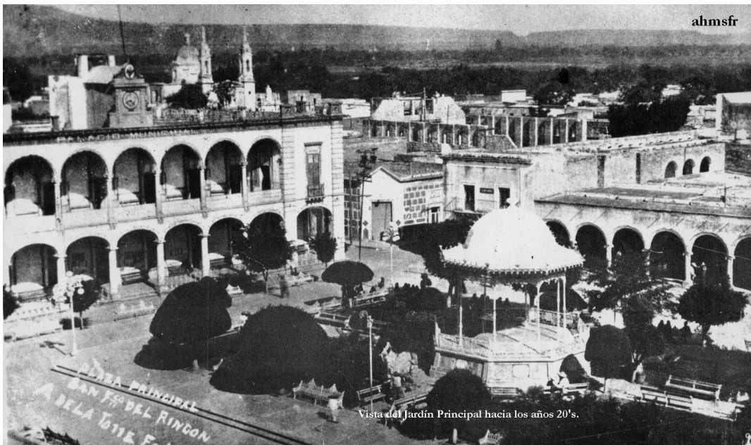
VISTA DEL JARDÍN PRINCIPAL HACIA LOS AÑOS 20'S