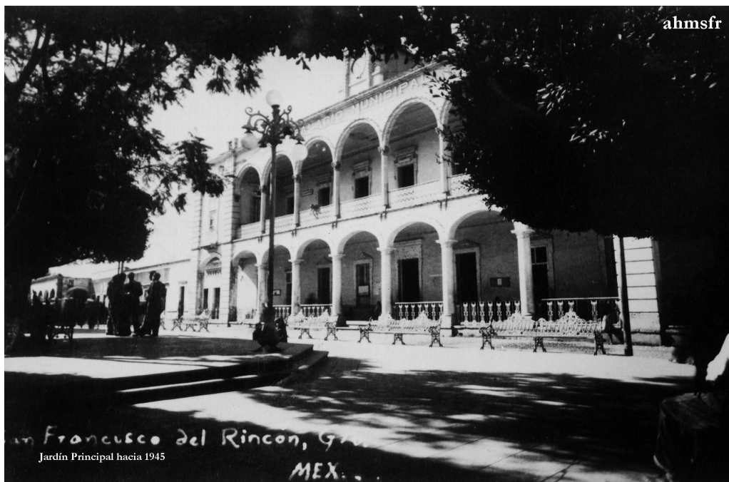
JARDÍN PRINCIPAL 1945