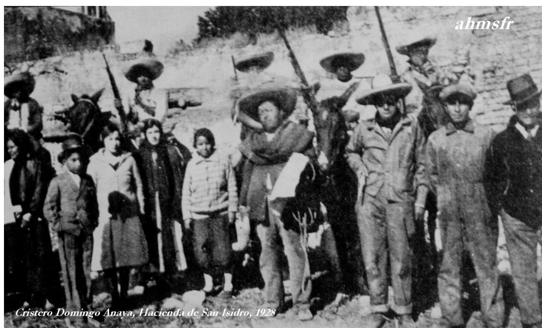
Cristero Domingo Anaya, Hacienda de San Isidro, 1928