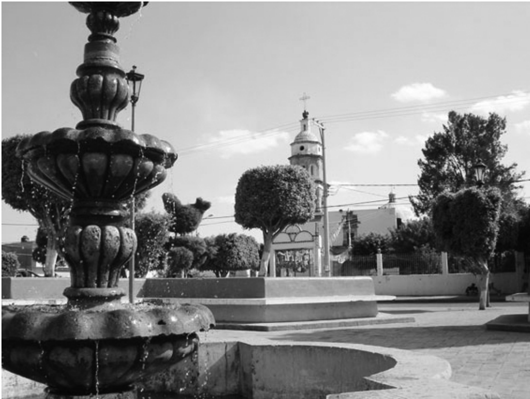
JARDÍN Y TEMPLO DE SAN MIGUEL