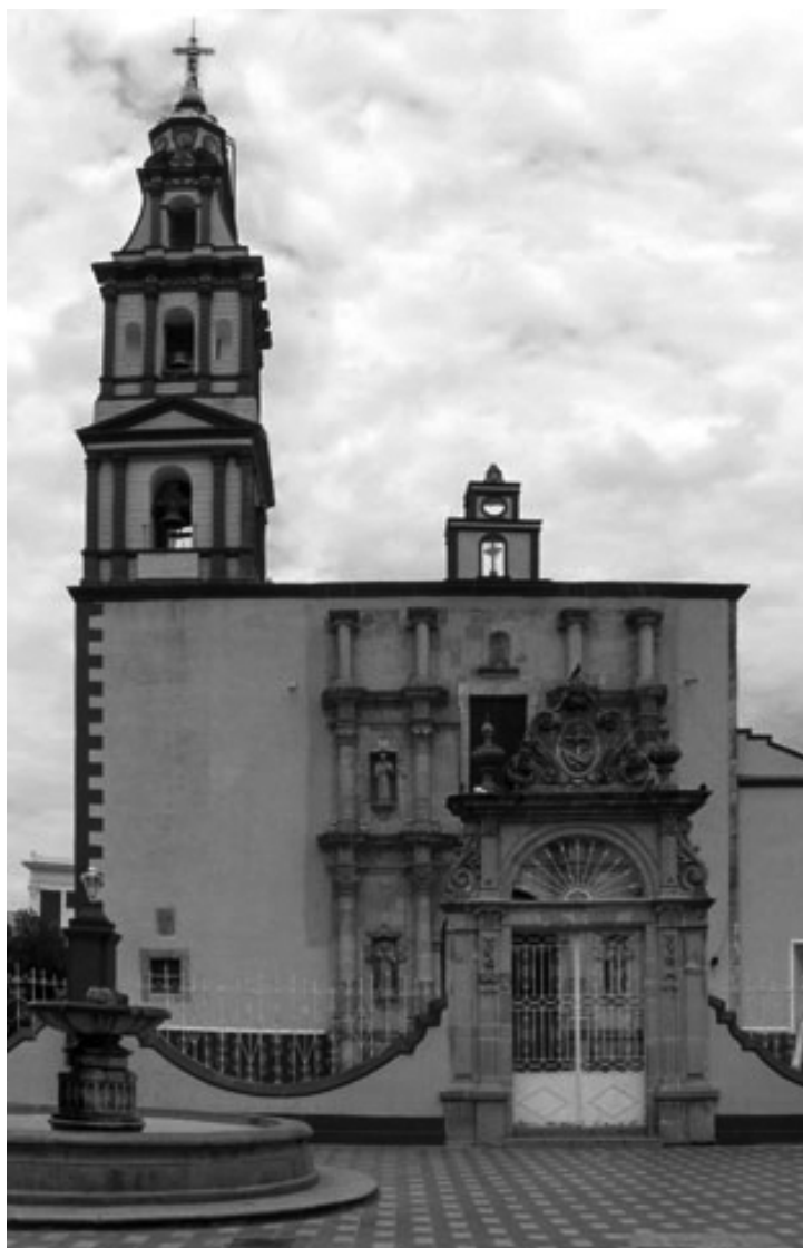
PARROQUIA DE SAN FRANCISCO DE ASÍS