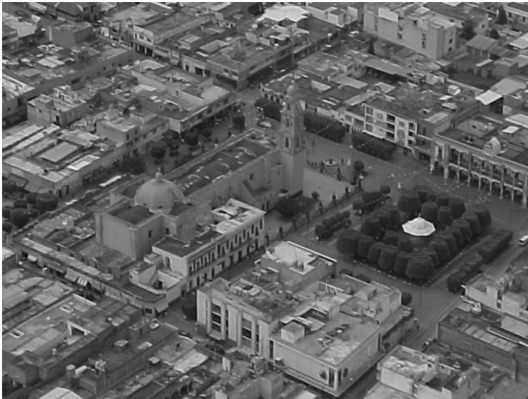
VISTA AEREA DEL CENTRO DE LA CIUDAD