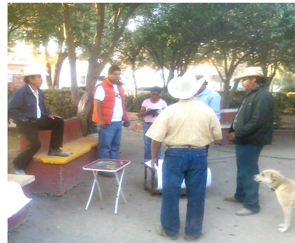
Asamblea de la comunidad en presencia de los integrantes del Consejo Indígena Estatal