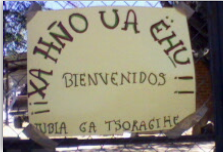
Letrero de bienvenida a la comunidad

“XA HÑO UA ÊHU (SEAN BIENVENIDOS) NUBIA GA TSOKAGIHE (HOY QUE VIENIERON A VISITARNOS)”.