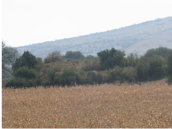
Cuisillo de la comunidad