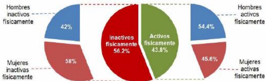
Población de 18 años y más, por condición de actividad físico-deportiva