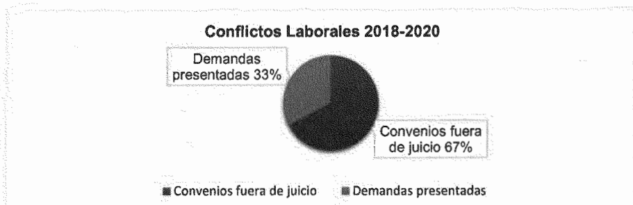
Gráfica 2. Guanajuato. Universo de Conflictos Laborales. 2018-2020