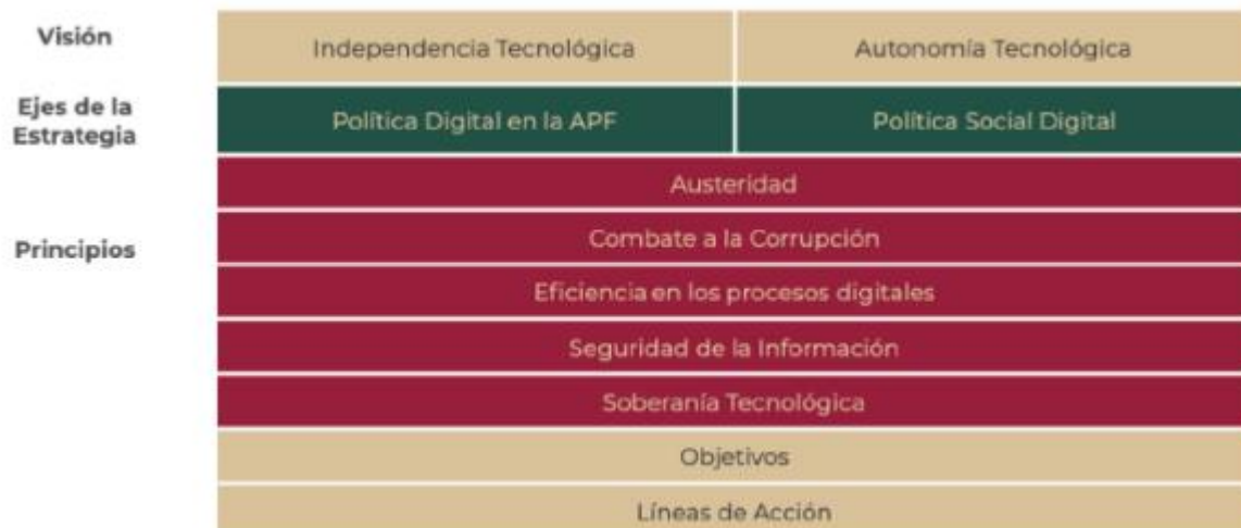
Figura 3. Marco estructural de la EDN

Los dos objetivos generales de la estrategia se componen de nueve objetivos específicos y líneas de acción identificadas como relevantes en materia de tecnologías, gobierno digital, conectividad, inclusión digital, software libre(2), estándares abiertos, digitalización de trámites, sistemas e infraestructura interoperables y seguridad de la información, que orientan el quehacer de las dependencias y entidades para dar sentido, unicidad y congruencia a esta Estrategia, cuya finalidad es una transformación centrada en las y los ciudadanos.