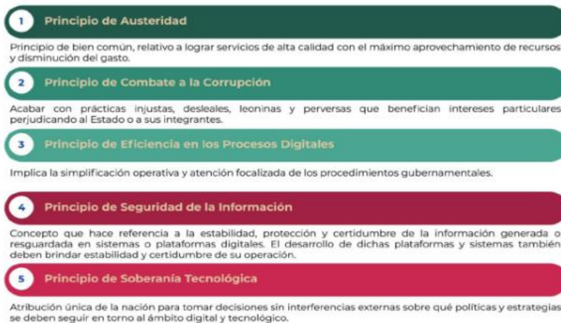
Figura 1. Principios de la EDN

La EDN aterriza las capacidades gubernamentales en la prioridad de atender los planteamientos de una adecuada gobernanza tecnológica, la mejora de los servicios digitales y la optimización de los procesos, enmarcando dichos propósitos en los siguientes principios: